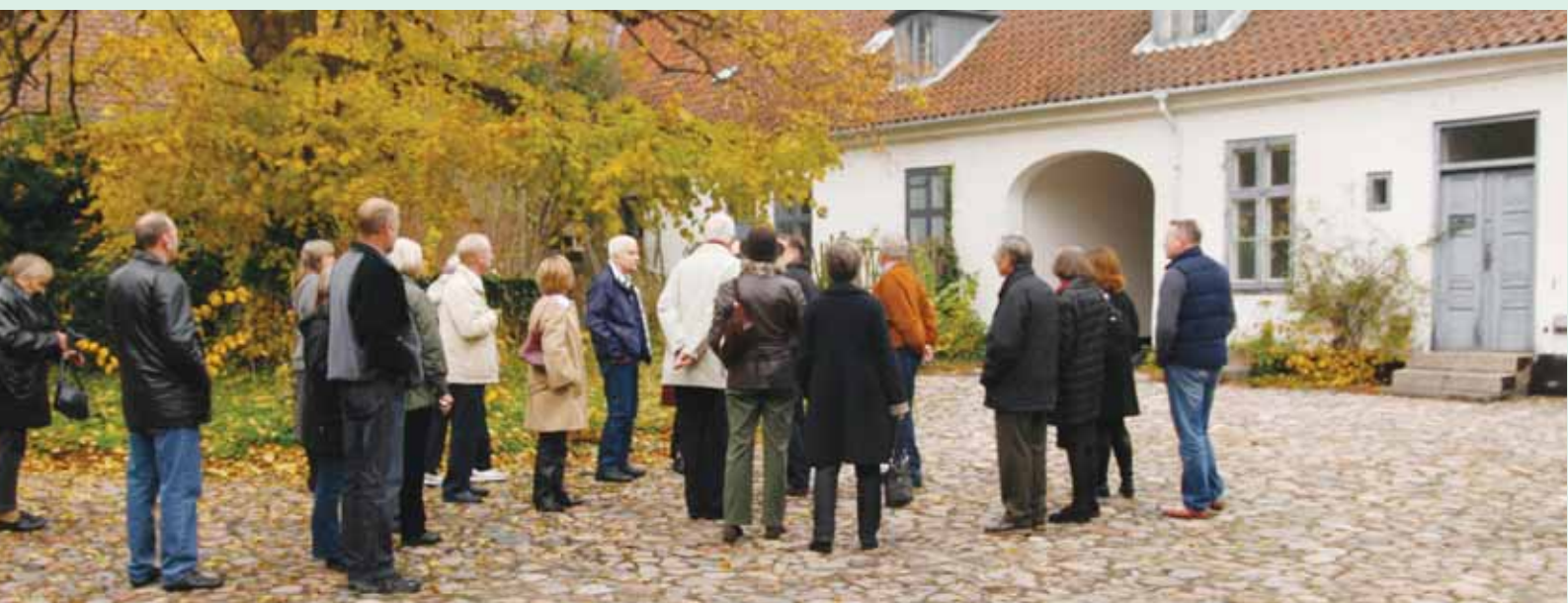
Ved Vintappergården var vi ude og høre om da Gentoft var landbrug

nisk Have), Jægersborg Allé forbi Charlottenlund Slot, Fort og Strandpark til Skovshoved. Her så vi den gamle milesten og mindestenen for frihedskæmperen "Flammen" ud for nr. 184 samt Skovshovedpigen over for Skovshoved Hotel. Turen fortsatte til Hvidørevej, hvor vi så Christansholms Fort i den tidligere vanddækkede grav, hvor nu Hvidørevej løber. Vi så Hvidøre Slot (der