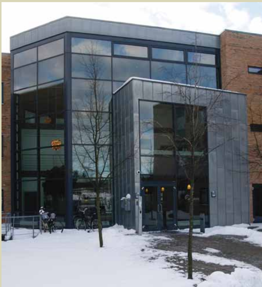
Den nye politistation på Ørnegårdsvej

strukturen, nu hvor den er ved at være på plads, har vist sig at give en mere smidig og effektiv arbejdsgang.