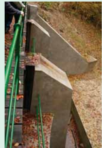
Dæmning I ved opførelsen i 1887. Forskningsbrædderne er netop afmonterede, og de militære ingeniører beundrer arbejdet. Til højre foto af det nyrenoverede anlæg.

kegårdsvej-Søndersøvej-Ermelundsvej returnerede vi til Stadion, hvor kaffen ventede i de smukke Arne Jacobsen-bygninger.